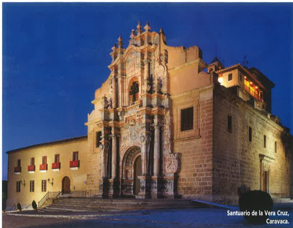
Santuario de la Vera Cruz, Caravaca.

ver algún águila real en lo alto. El tramo se complica con ascensos. Sigue siempre la Vía Verde del Noroeste, te llevará hasta El Niño de Mula, un habitual lugar de peregrinación, parada casi obligatoria para visitar su Santuario, tomar un refrigerio y reponer fuerzas. El mejor mes para acudir es septiembre, fecha de las fiestas tradicionales en las que el pueblo conmemora la aparición del Niño Jesús a un pastor de la zona. Sin duda los milagros y la religiosidad impregnan cada tramo del camino. Ya en Bullas, se encuentra la Iglesia de Nuestra Señora del Rosario y un Museo del Vino que no podía faltar en la que es tierra de viñedos y productos con Denominación de Origen; y si