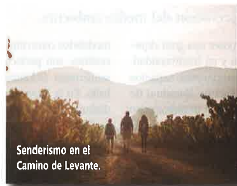
Senderismo en el Camino de Levante.

El Camino de Levante es el escape de una gran parte de las localidades de la Región. Una parada interesante son las ruinas de Begastri, una antigua ciudad romana que fue sede episcopal en época visigoda, entre los siglos VI y VIII. Uno de los