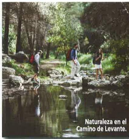
Naturaleza en el Camino de Levante.

Estando en Murcia se pueden visitar el Palacio Episcopal o el Museo Salzillo, además del Malecón, una construcción histórica concebida para detener el empuje de las avenidas del río Segura. Dejando atrás la ciudad, aparecen una serie de pedanías tradicionales que guardan secretos de la huerta murciana, como la gran rueda que se conserva en la Ñora y que es una seña distintiva de este lugar, el Museo de la Huerta y la Ermita de Nuestra Señora de la Salud. Por el ca-