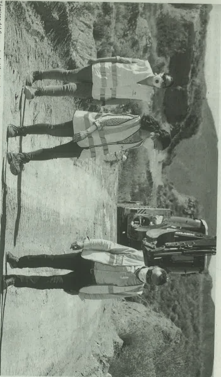
Técnicos del Consorcio de Vías Verdes de la Región de Murcia supervisan los trabajos, esta semana. CLAUDIO CABALLERO