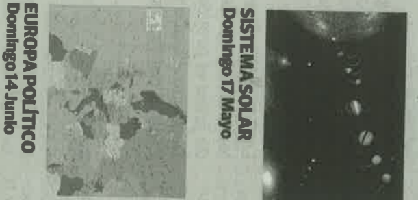
SISTEMA SOLAR Domingo 17 Mayo