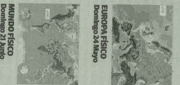
EUROPA FÍSICO Domingo 24 Mayo