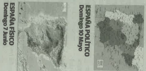
ESPAÑA POLÍTICO Domingo 10 Mayo