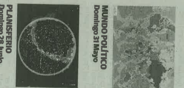
MUNDO POLÍTICO Domingo 31 Mayo