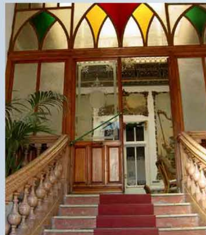
Casino. Escalera interior

En cuanto a las pinturas del Salón de Baile, que representaban unos bucólicos paisajes, fueron desprendidas de su