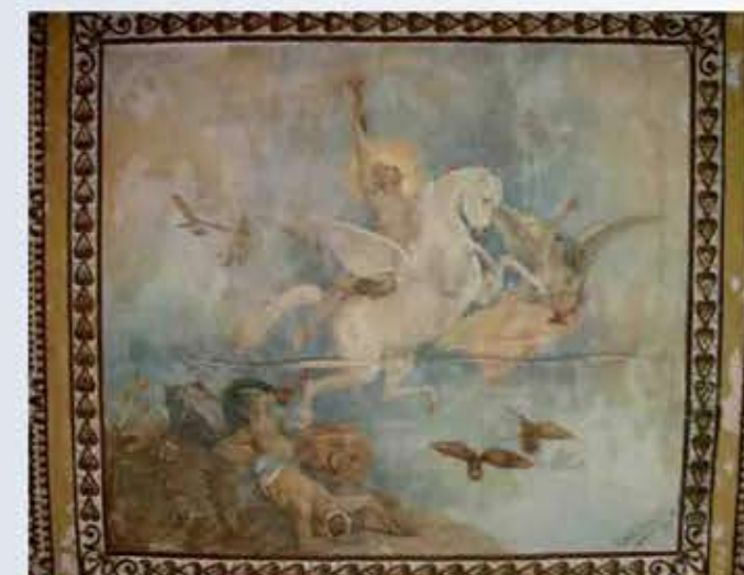
Casino. Pintura decorativa del Salon de Baile