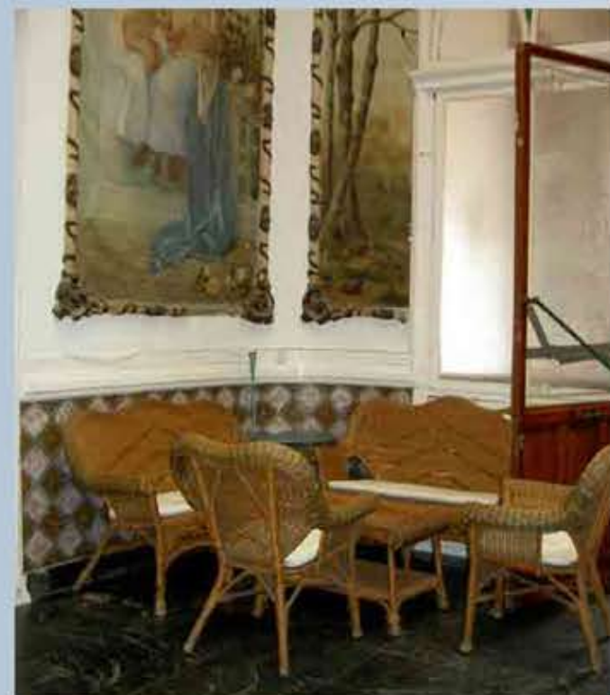
Café del Casino

en torno a un patio de luces y que cuenta con una cubierta metálica. El programa decorativo del Casino de Águilas se planteó como evocación de los valores burgueses de la época, ya que el edificio estaba dirigido a los veraneantes, en particular a la alta sociedad lorquina, que hizo de Águilas su destino habitual. Del edificio sobresalen la escalera y el patio de luces, ambos con lienzos realizados en 1905 como hemos mencionado anteriormente, por el totanero José Sánchez Carlos.