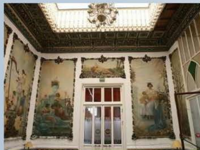
Casino. Pintura decorativa del Salon de Baile