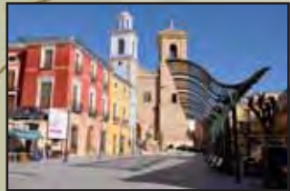
Plaza del Ayuntamiento