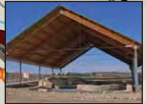
Yacimiento de Villaricos