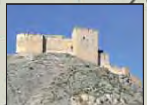
Castillo de los Velez