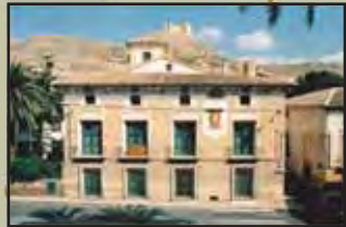
Museo del Cigarralejo