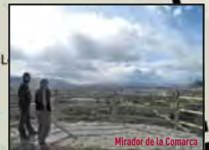
Mirador de la Comarca