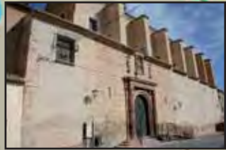
Iglesia de Santo Domingo de Guzmán