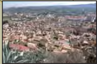
Mirador del Pueblo y sus Alrededores