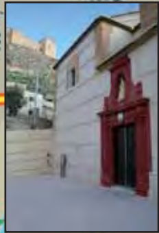
Ermita de Ntra. Sra. del Carmen