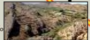
Mirador del Cigarralejo