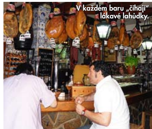
V každém baru „číhají“ lákavé lahůdky.