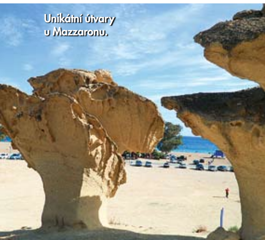
Unikátní útvary u Mazzaronu.