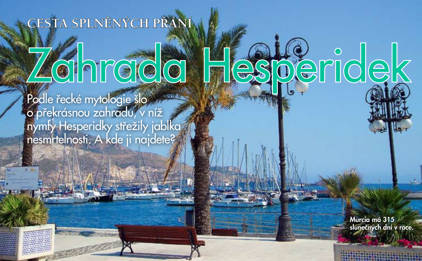
Murcia má 315 slunečných dní v roce.

Podle řecké mytologie šlo o překrásnou zahradu, v níž nymfy Hesperidky strážily jablka nesmrtelnosti. A kde ji najdete?