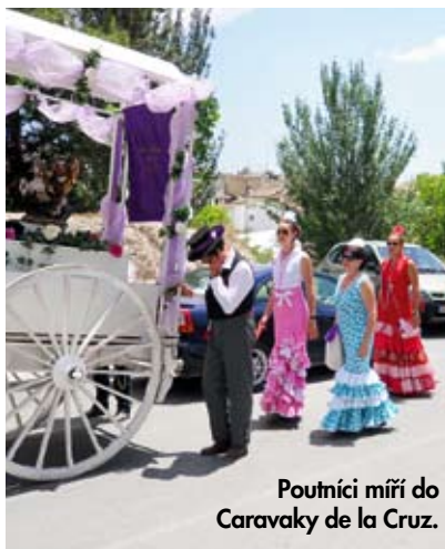
Poutníci míří do Caravaky de la Cruz.