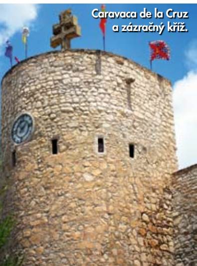
Caravaca de la Cruz a zázračný kříž.

Podstatné však je, že moře dodává Murcii i něco navíc – ryby a mořské plody, zejména gambas roja, což jsou krevety z hloubky 250 m. Těch si tu užijete dosyta stejně jako výtečného místního vína (zkuste bílou odrůdu macabeo a červené tempranillo či monastrell). Báječný je i murcijský salát, kaldero (považené ryby s rýží, sušenou paprikou, vymačkaným pomerančem, citronem a česnekem), kozí sýr, který zraje v červeném víně, chanquette, tedy miniaturní úhoří v česneku a oleji, crespillos čili křupky k vínu či pivu a samozřejmě místní sladkost – našlehaný bílek s lískovým oříškem. Zkratka Murciu je třeba si vychutnat všemi smysly, je to totiž země vůní, citů a pocitů. ●