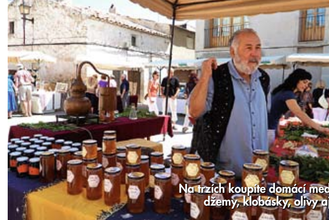
Na trzích koupíte domácí med, džemy, klobásky, olivy aj.

Srdcem města je velkolepá katedrála. Stavěli ji ve