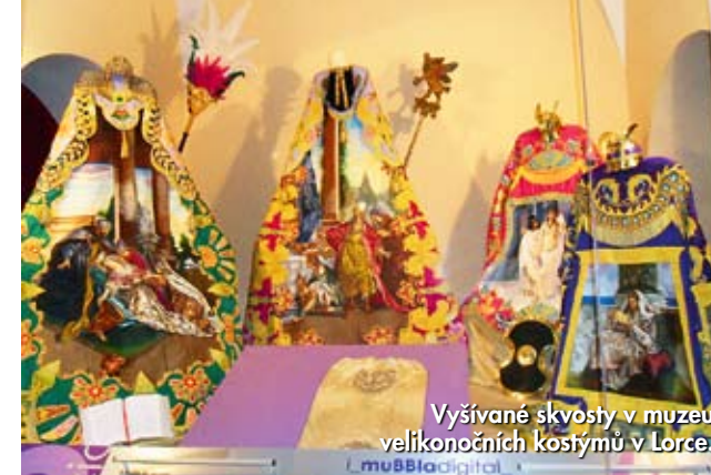
Vyšívání skvosty v muzeu velikonočních kostýmů v Lorca.

14.–18. století a asi nepřekvapí, že přímo na základech mešity. Ve směsici stylů (věžičky připomínají spíš pagody) je těžké se zorientovat, a tak se spokojme s označením středomořská gotika. Dominuje jí prý nejvyšší zvonice ve Španělsku, jež ční do výšky 90 m. Uvnitř překvapivě světlé trojlodní katedrály se ochladíte a pak vás ohromí zejména pozdně gotická kaple markýze Veléze s kamenným portálem a bohatými reliéfy.