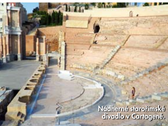
Nádherné starořímské divadlo v Cartageně.

Ačkoli přístav Cartagena založili Kartaginští, tedy