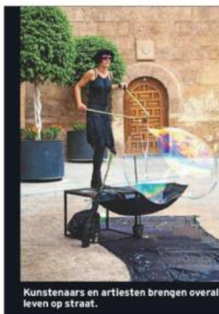
Kunstenaars en artiesten brengen overal leven op straat.