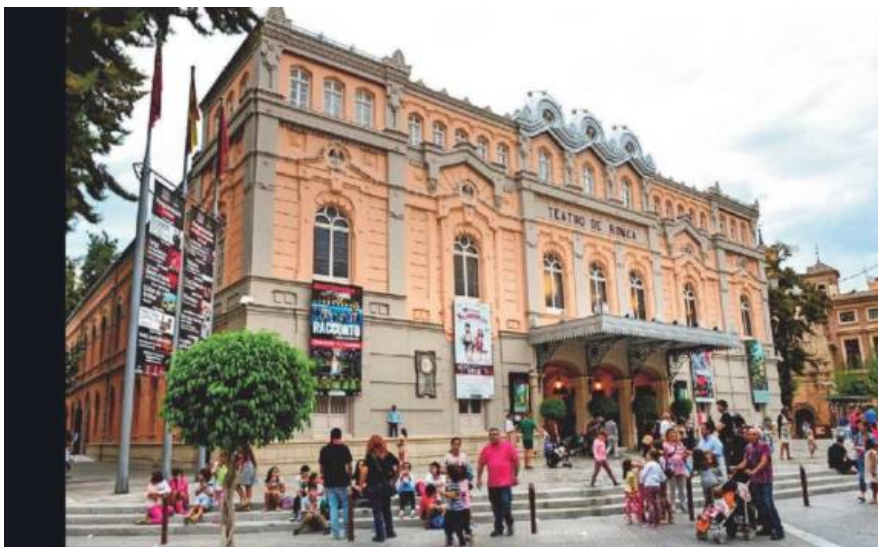
Een drukte van jewelste op het plein voor het Teatro Roma. Het grootste theater van Murcia is meteen een van de belangrijkste van heel Spanje.