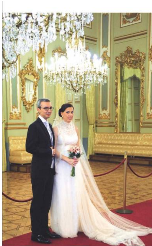
Het stadspaleis Real Casino is ook een geliefd decor voor trouwfoto's.

App: je kan de gratis app 'turismomurcia' downloaden met alle bezienswaardigheden, musea, parken en monumenten met hun respectieve openingstijden.