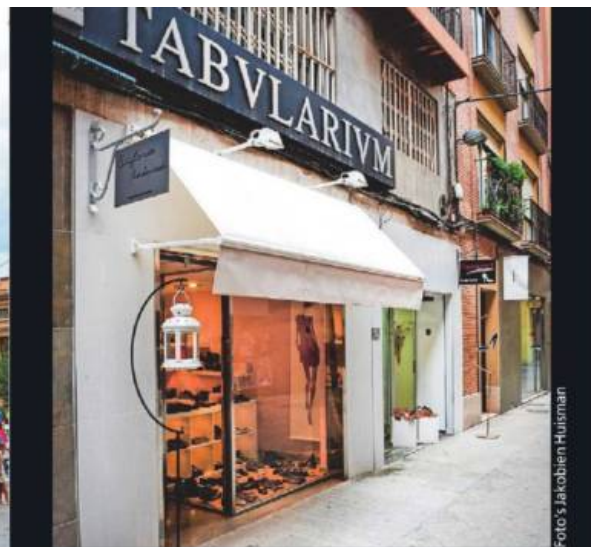
Verwacht je niet aan de bekende namen en ketens in de winkelstraten, wel aan kleine, unieke boetieks.