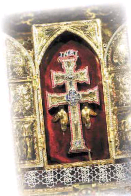
Salto del Usero

Santísima y Vera Cruz es el símbolo que caracteriza al municipio caravaqueño, una cruz de doble brazo que alberga en su interior el «Lignum Crucis», un trozo de madera que pertenece al leño donde fue crucificado Cristo