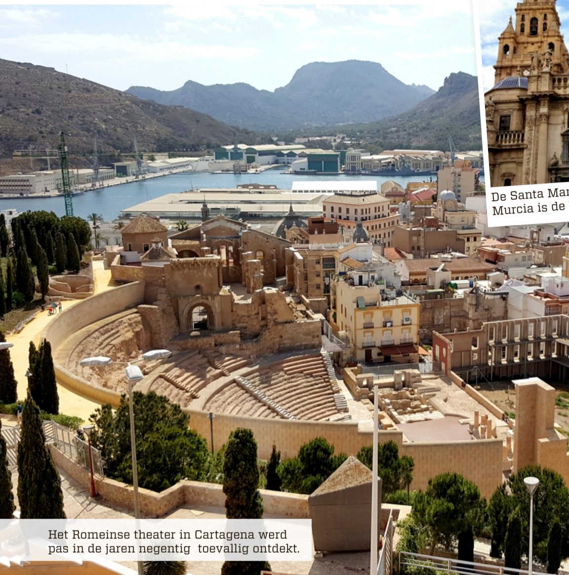
Het Romeinse theater in Cartagena werd pas in de jaren negentig toevallig ontdekt.

is dit de grootste lagune van Europa. Je kunt hier al snel honderden meters ver wandelen en nog steeds niet kopje onder gaan. Het diepste punt is zeven meter diep. Daarom wordt het ook wel eens het grootste zwembad van Europa genoemd. Een zee in een zee, afgesloten door La Manga, een strook land van twintig kilometer lang. Dit smalle en lang uitgerekte schiereiland maakt van 170 km 2 Middellandse Zee een unieke zoute binnenzee. Het water is er zeer kalm omdat La Manga – hoogstens een kilometer of twee breed – als natuurlijke