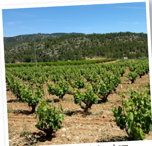
Wijnregio Bullas staat bekend om zijn rode wijnen en rosés afkomstig van de monastrelldruif.

dronken er maar liefst 500 mensen. Onnodig zo bleek, want het schip bleef nog twee weken lang op de rots vastgeklemd zitten. Een plaatselijke visser redde 450 mensen door zijn schip tegen de Italiaanse cruiser te rammen zodat mensen konden overstappen. Een gedenkplaat met zijn naam en een beschrijving van zijn daad vind je terug aan de vuurtoren die de kaap en omstreken domineert. Een model van het Italiaanse schip, enkele krantenartikels en vondsten zijn te bezichtigen in het vlakbij gelegen toeristische centrum Planeta Azul. Helemaal in het noorden van de Mar Menor ligt het dorpje San Pedro del Pinatar, met op zijn grondgebied het prach-