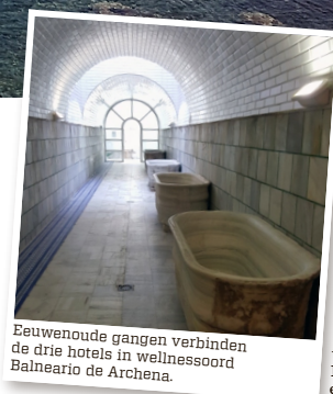
Eeuwenoude gangen verbinden de drie hotels in wellnessoord Balneario de Archena.

Op slechts een uurtje rijden van de hoofdstad Murcia vinden we tussen de talrijke wijngaarden een oase van rust. Vergeet heel even de Elzas of de Moezel, de regio rond Bullas staat vooral bekend om zijn rode wijnen en