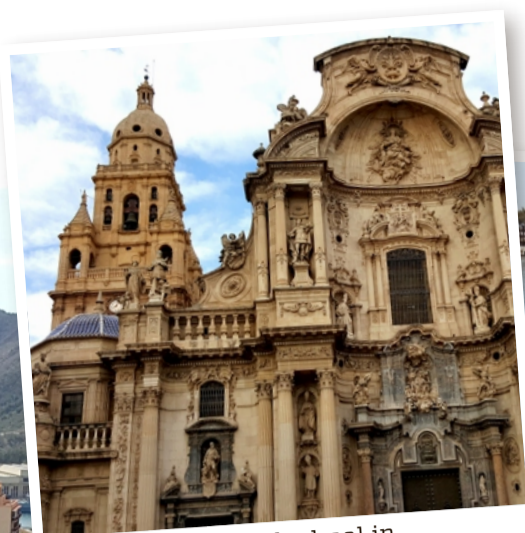
De Santa María-kathedraal in Murcia is de hoogste van Spanje.