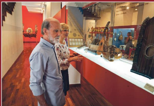
Museo de Música Étnica de Barranda.

El Camino de Levante permite disfrutar de un paisaje variado y donde encontramos una parte importante del patrimonio natural y cultural de la Región de Murcia