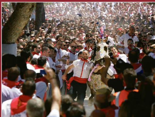
Fiesta de los Caballos del Vino.