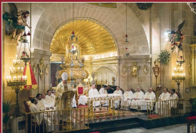
Interior del santuario de la Vera Cruz.

En Caravaca de la Cruz se custodia la Vera Cruz, una reliquia venerada desde el siglo XIII en cuyo interior se guardan fragmentos de la cruz de Cristo