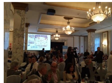
Retrospectiva de una de las zonas del banquete repartido por varias estancias diferentes del Hotel Palace Barcelona.