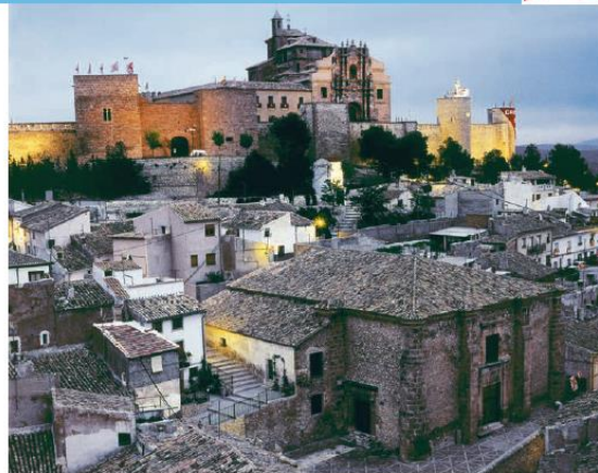
Vista del Santuario y La Encarnación. Caravaca de la Cruz.