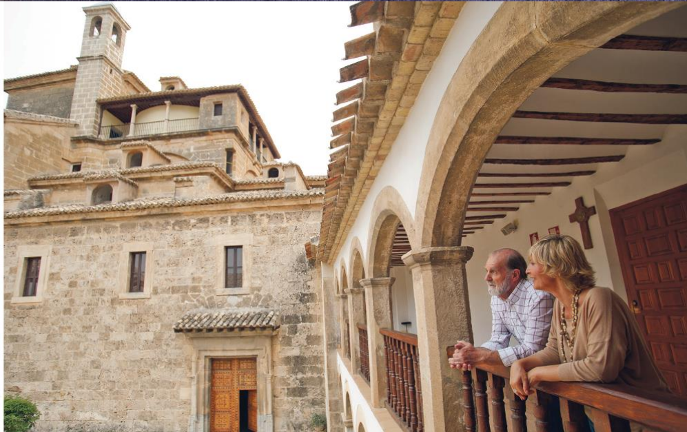
Claustro del santuario de Caravaca de la Cruz.

Caravaca de la Cruz es una ciudad situada en un enclave fronterizo, un cruce de caminos entre la Región de Murcia y Granada. Iberos, romanos y musulmanes pasaron por esta población que se asienta en torno a su castillo, que aunque de origen árabe, fue custodiado por la orden del Temple y posteriormente por la de Santiago. Pero Caravaca es esencialmente la Ciudad de la Cruz. Según cuenta la leyenda, en 1232 el rey moro Abu Zeid se convirtió al cristianismo cuando contempló cómo dos ángeles bajaban del cielo una cruz para que un sacerdote preso en el castillo pudiera decir misa. Esta historia dio lugar a la construcción del santuario de la Vera Cruz a partir de 1617 en el