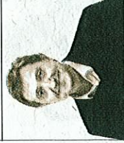
COMENTARIOS LIBERALES F. JIMÉNEZ LOSANTOS