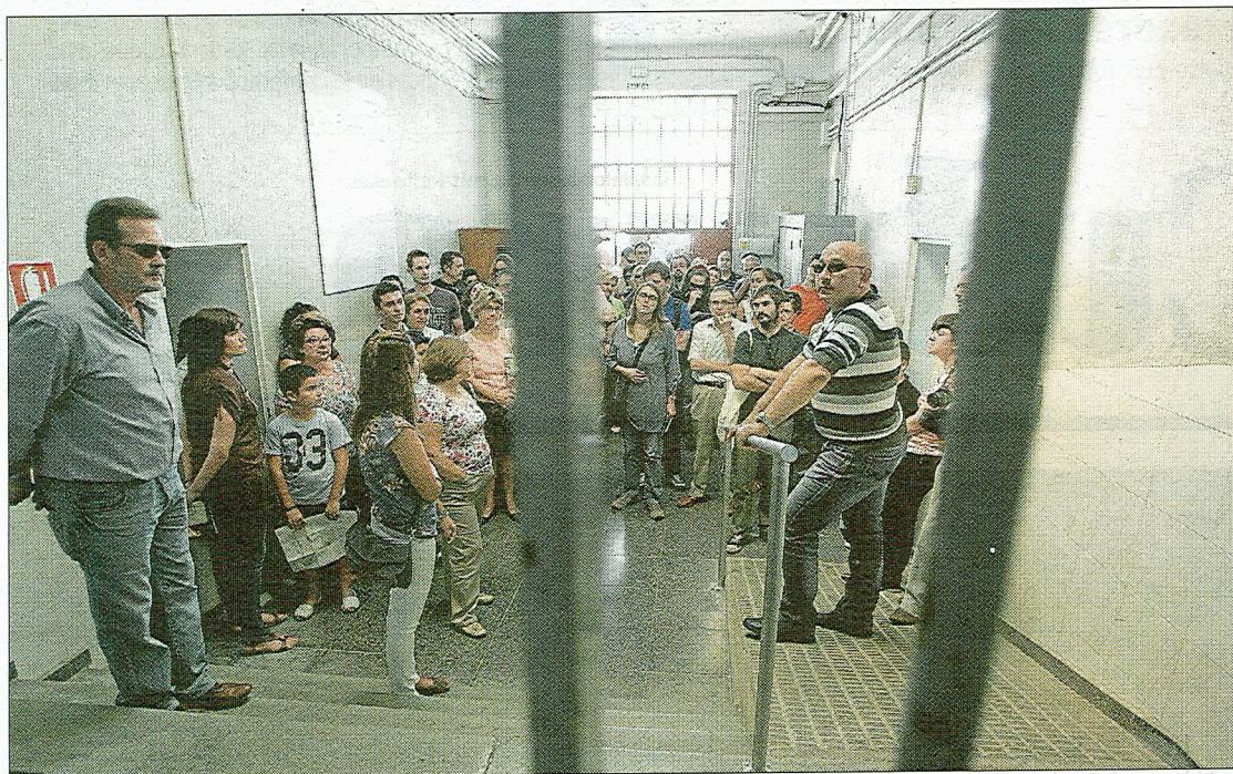
Numerosas personas se adentraron en la cárcel de San Antón para ver las obras de Manifesta