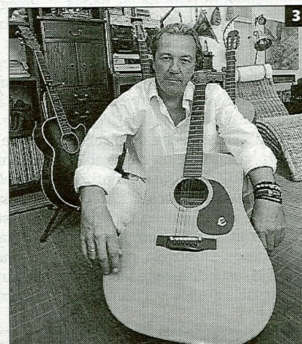
► DE TODOS LOS GÉNEROS 1 Notas de cocina abre la programación. 2 Alquibla vuelve a representar Las reinas del Orinoco . 3 Oché Cortés recordará a Miguel Hernández. 4 ÁGUEDA PÉREZ 4 El Ballet Español de Murcia actuará en El Palmar. © JUAN CABALLERO

comedia, teatro clásico, magia, títeres, ballet y música.