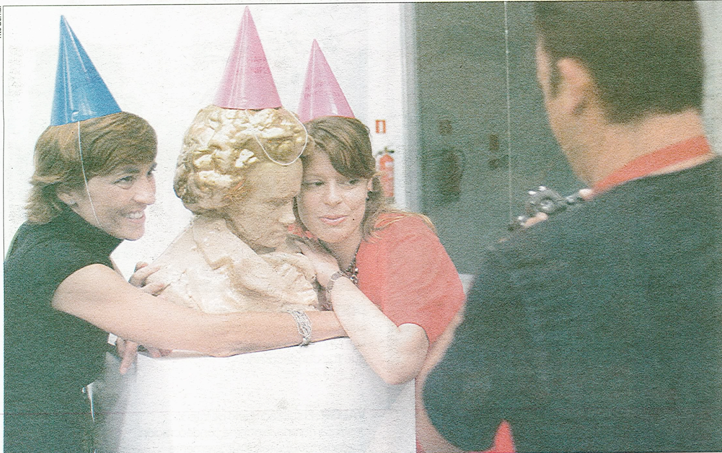
DIVERSION. Dos de las asistentes posan con una de las esculturas de la sala