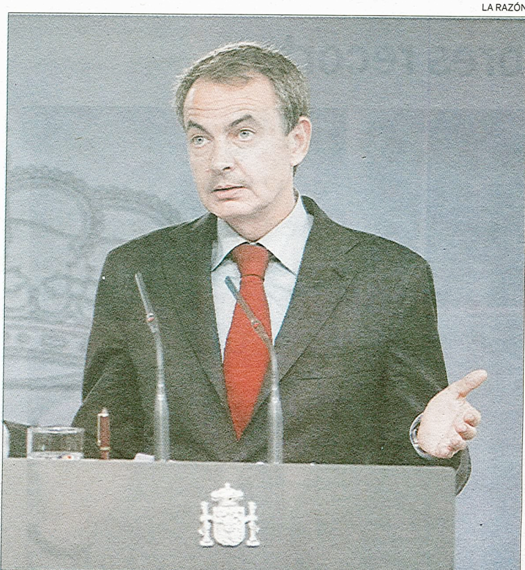
El presidente del Gobierno de España, José Luis Rodríguez Zapatero, en una imagen de archivo reciente