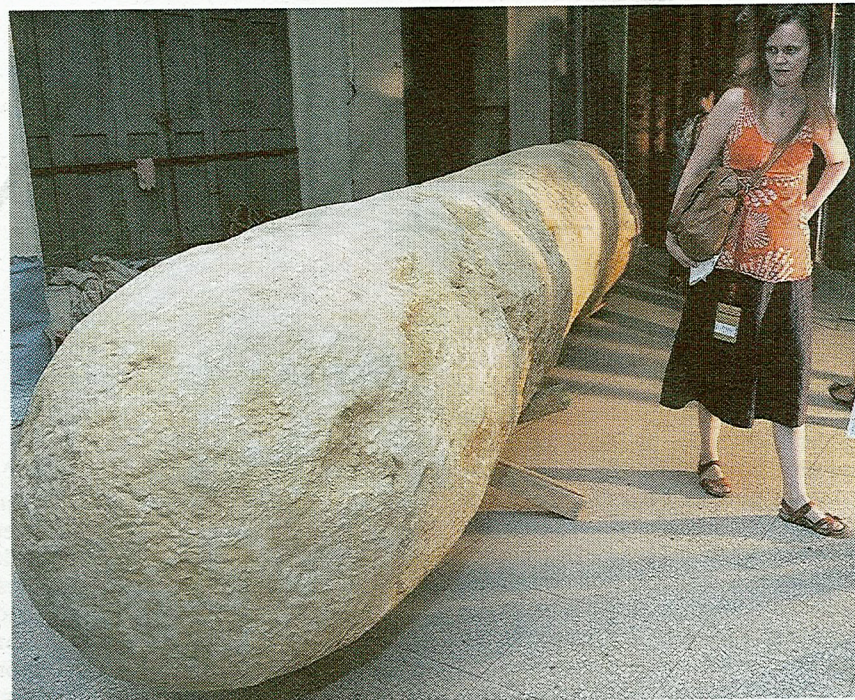
La antigua Oficina de Correos de Murcia, una de las sedes.

Pero ahora estamos en Murcia, donde sí se ha inaugurado la Manifesta y donde ha venido todo el mundo del arte nacional y buena parte del internacional para saber cuáles son las propuestas de los tres equipos curatoriales, en los que se mezclan profesionales de Egipto, Oriente Próximo, Italia, Estados Unidos, Eslovaquia... (de aquí y de allá, se diría). Todos ellos han trabajado durante dos años para seleccionar la larga lista de artistas, cerca de cien, elegidos con un afán cosmopolita más que de mirarse el ombligo local o nacional, de los cua-