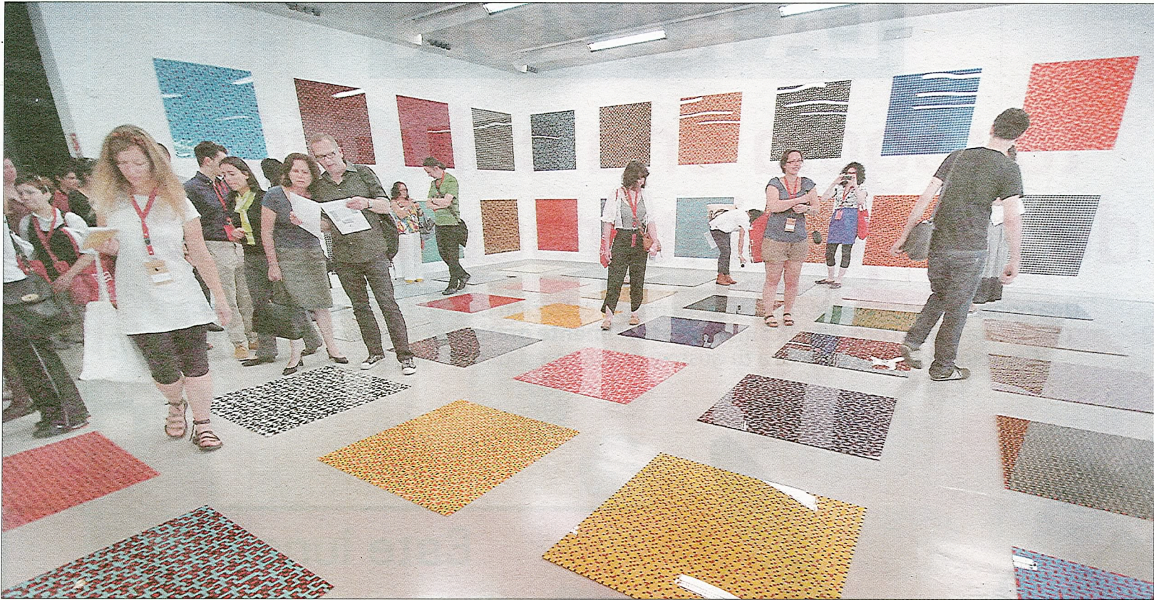
COLOR. Una de las salas del Muram muestra una gran variedad de colores y texturas en su interior