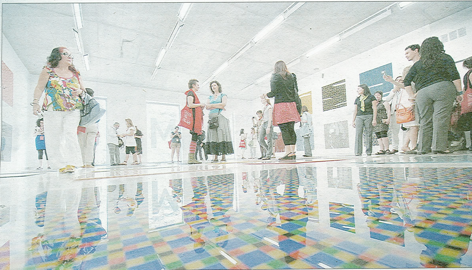
Una de las salas del Museo Regional de Arte Moderno (Muram) de Cartagena, ayer, visitado por los profesionales del arte y periodistas