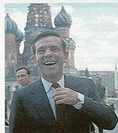
Norman Wisdom.

Aunque su popularidad se circunscribió sobre todo a su país natal, el actor era una estrella en Albania, donde sus películas fueron las únicas del cine occidental que llegaron a estrenarse durante la dictadura de Enver Hoxha, en Sudáfrica.