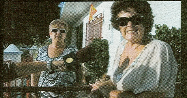
Cinco secuencias del vídeo promocional de Torre Pacheco, en el que varios vecinos se oponen a la supuesta llegada de los 'brangelines'.