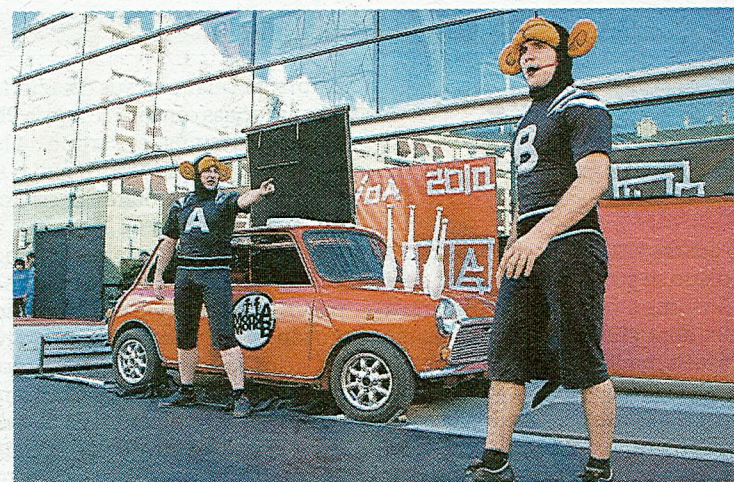
Espectáculo 'Mono A Mono B'.