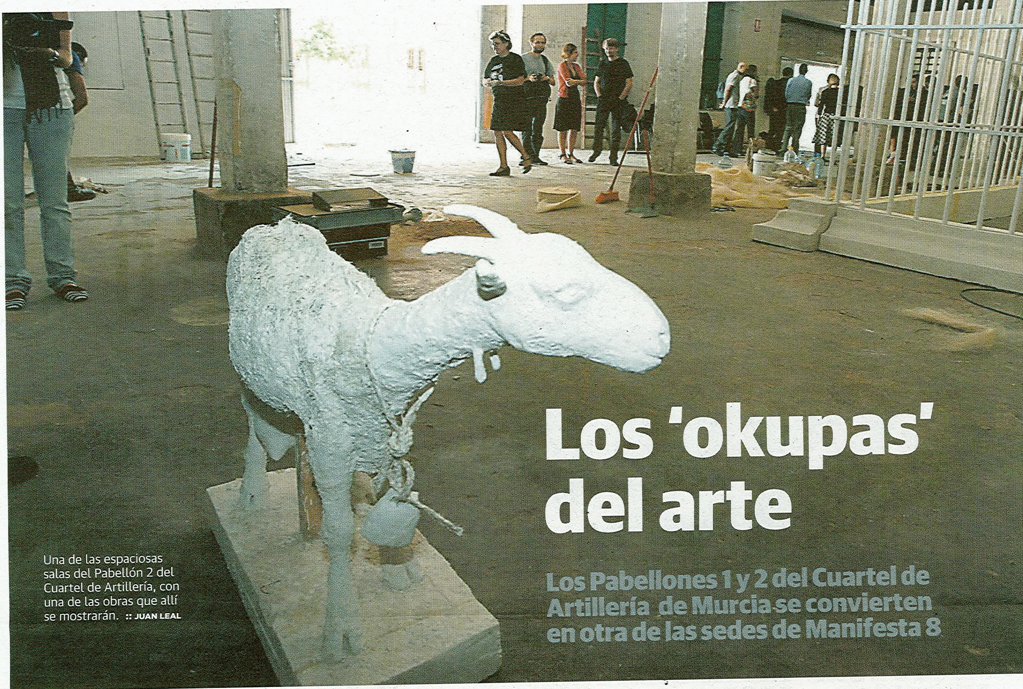
Una de las espaciaosas salas del Pabellón 2 del Cuartel de Artillería, con una de las obras que allí se mostrarán.