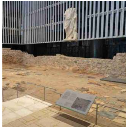
^ Museo del Foro Romano

La visita culmina con el recorrido por importantes vestigios de época romana como la Curia, el Foro, el Santuario de Isis, las antiguas calzadas romanas, las Termas del Puerto y su pórtico de acceso para terminar en el edificio del Atrio.