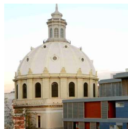
^ Basílica de la Caridad