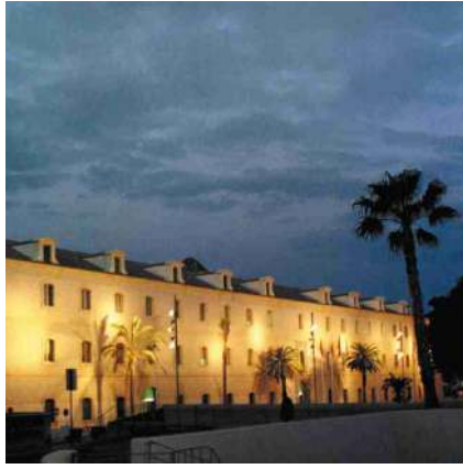
^ Campus Muralla del Mar