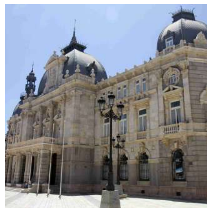
^ Palacio Consistorial