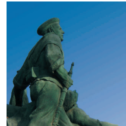
^ Monumento a los Héroes de Santiago de Cuba y Cavite