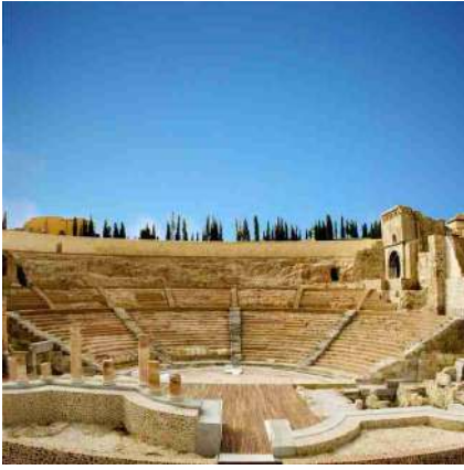
^ Teatro Romano