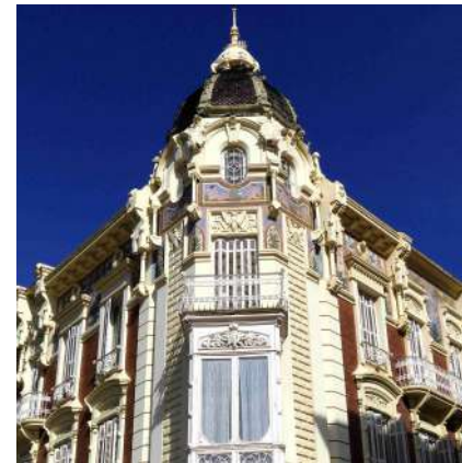
^ Casa Aguirre. MURAM