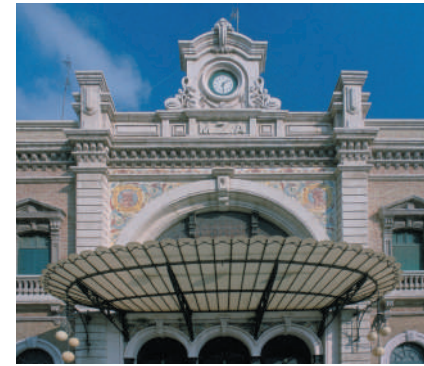
^ Estación de Ferrocarril