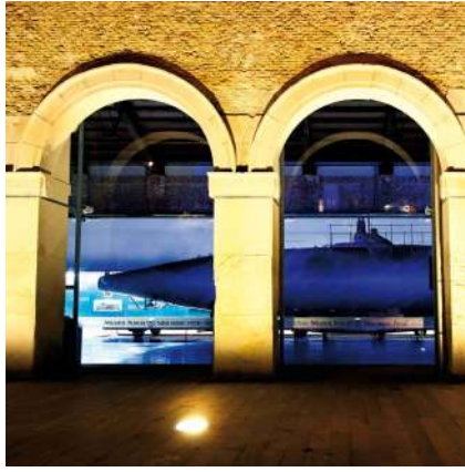
^ Museo Naval