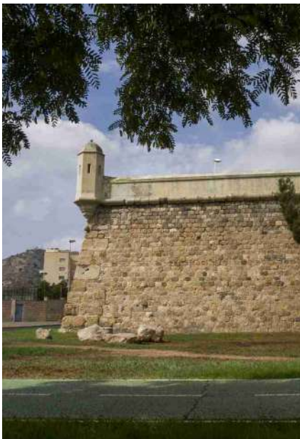
^ Muralla de Carlos III