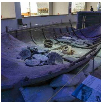
^ Museo Nacional de Arqueología Subacuática. ARQUA