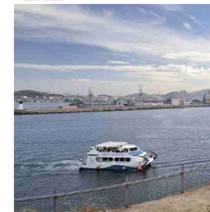
^ Barco Turístico